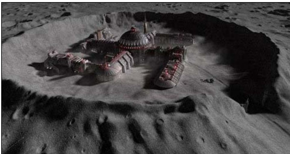
Artist's rendering of swastika found in the Schrödinger crater of the Moon during Cassiopeia probe courtesy of Bibiana Bryson, Exopolitica Argentina.