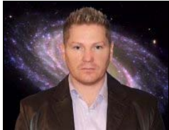
Danny Pid May 28, 2010 at 4:53 pm

Busco información de esta foto. Me parece muy interesante y desearía encontrar la original de NASA. ¿Alguien tiene más datos?